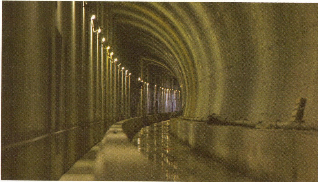
Der 8,6 Kilometer lange Tunnel zwischen dem Flughafen Schiphol und Rotterdam wurde mit einem umfassenden Sicherheitskonzept mit ausgeklügeltem Brandschutz errichtet.

Brandschutz-Spritzbeton entschieden. Bewehrungsmatten aus Edelstahl verstärken die Widerstandsfähigkeit der Brandschutzschicht zusätzlich. Der Arm eines computergesteuerten Sprayroboters versprüht das mineralische und faserfreie Gemisch aus einem angehängten Silowagen gleichmäßig und schnell auf die Tunnelelemente – insgesamt 190.000 Quadratmeter. Die Bewehrungsmatten wurden mit 1,9 Millionen Einschlagankern und so genannten Niederhaltern aus Edelstahl A4 befestigt.