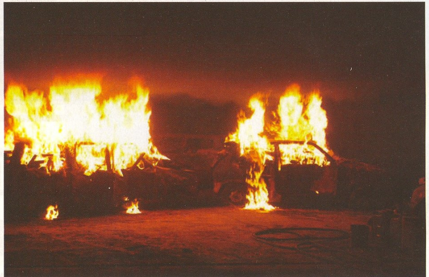
Brand im Tunnel – hier im Versuchsstollen Hagerbach in Flums, Schweiz. In der Rauchentwicklung lauert die tödliche Gefahr.

Erhöhte Sicherheitsmaßnahmen sind nicht zuletzt aufgrund der Tunnelkatastrophen der vergangenen Jahre das Thema im Tunnelbau. Die Innovationen im Dienste der Baubranche sind enorm. Ein Roboter verlegt Brandschutzplatten. Brandbeständige Baustoffe oder auch ausgetüftelte Rauchabzüge sind weitere Innovationen in den heutigen Tunnelbauten. Die Entscheidung über die Ausführung des Brandschutzes trifft der Bauunternehmer in Kooperation mit dem Bauherren. Dementsprechend hoch ist die Verantwortung. Die verheerenden Tunnelunglücke der vergangenen Jahre forcierten die Sicherheitsmaßnahmen im Tunnelbau. Bestehende Tunnel werden adaptiert, bei Neuplanungen erhält Sicherheit mit dem Schwerpunkt Brandschutz oberste Priorität. Volker Wetzig, Leiter des Versuchsstollens Hagerbach in Flums, Schweiz, betont: „Die Katastrophen entstehen nicht durch den Brand, die Menschen verunglücken – ersticken – am bzw. im Rauch.“ Das heißt, neben dem Brandschutz ist die rasche Ableitung des Rauches ein wichtiger Planungsaspekt. Wetzig räumt aber zugleich ein, dass es im Tunnelbau immer wieder zu unvorhersehbaren Situationen kommt: „Wir testen hier im Versuchsstollen Materialien, Brandschutzplatten wie auch Bauweisen, doch neben der Dimensionierung von Tunnels ist auch die Befestigungstechnik ein wesentlicher Si-